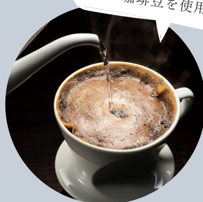
ハンドドリップ珈琲 デカフェ