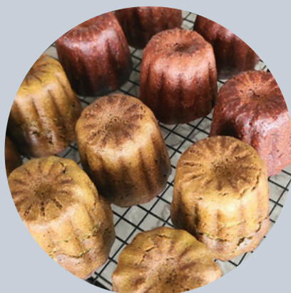
米粉の ビーガンカヌレ